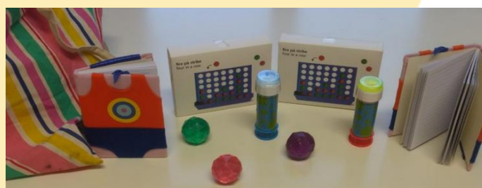
Ευχαριστήρια δώρα για τα παιδιά