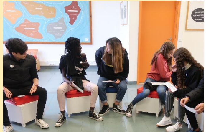
Ένας κατάλληλος χώρος για τα παιδιά που χρησιμοποιείται από τις εταιρίες του IJCC στην Πορτογαλία (η φωτογραφία δεν απεικονίζει παιδιά που έλαβαν μέρος στο πρόγραμμα IJCC και επισυνάπτεται με την άδεια των νέων που εμφανίζονται σε

Η ασφάλεια είναι σημαντικός παράγοντας. Μπορεί να υπάρχουν περιοχές που δεν είναι ασφαλείς για τα παιδιά λόγω του κινδύνου να συναντηθούν με τον δράστη τους. Εάν νοικιάζετε χώρο για την πραγματοποίηση των δραστηριοτήτων, βεβαιωθείτε ότι η περιοχή στην οποία βρίσκεται είναι ασφαλής για όλα τα μέλη. Προσπαθήστε να συναντιέστε σε ουδέτερους χώρους παρά σε καταλύματα κατά της ενδοοικογενειακής βίας.